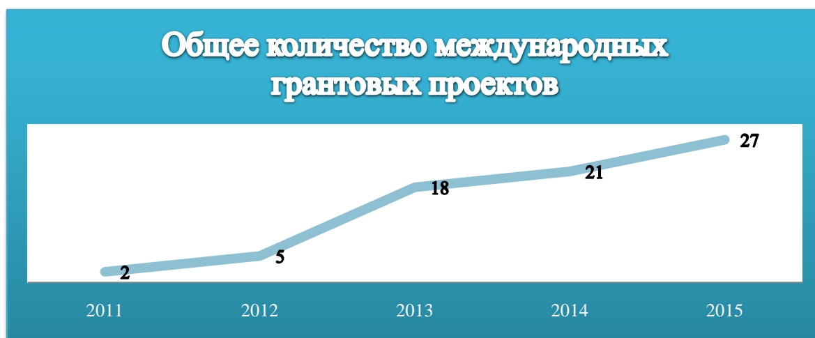
Схема 2. Количество международных проектов 2011-2015гг.

Наиболее крупным из программ академической мобильности является проект ERASMUS MUNDUS «Humanities Education Revitalized via Mundus ExperienceS» 2013-16гг. ( http://international.rau.am/eng/international-projects/hermes ), в рамках которого осуществляются программы мобильности на всех уровнях совместно с семью европейскими университетами и летняя программа «Сеть Восток-Запад» 2013-16гг. ( http://international.rau.am/eng/summer-and-winter-programs/network-east-west-exchange ), которая осуществляется совместно с Юридическим факультетом Гумбольдтского Университета.