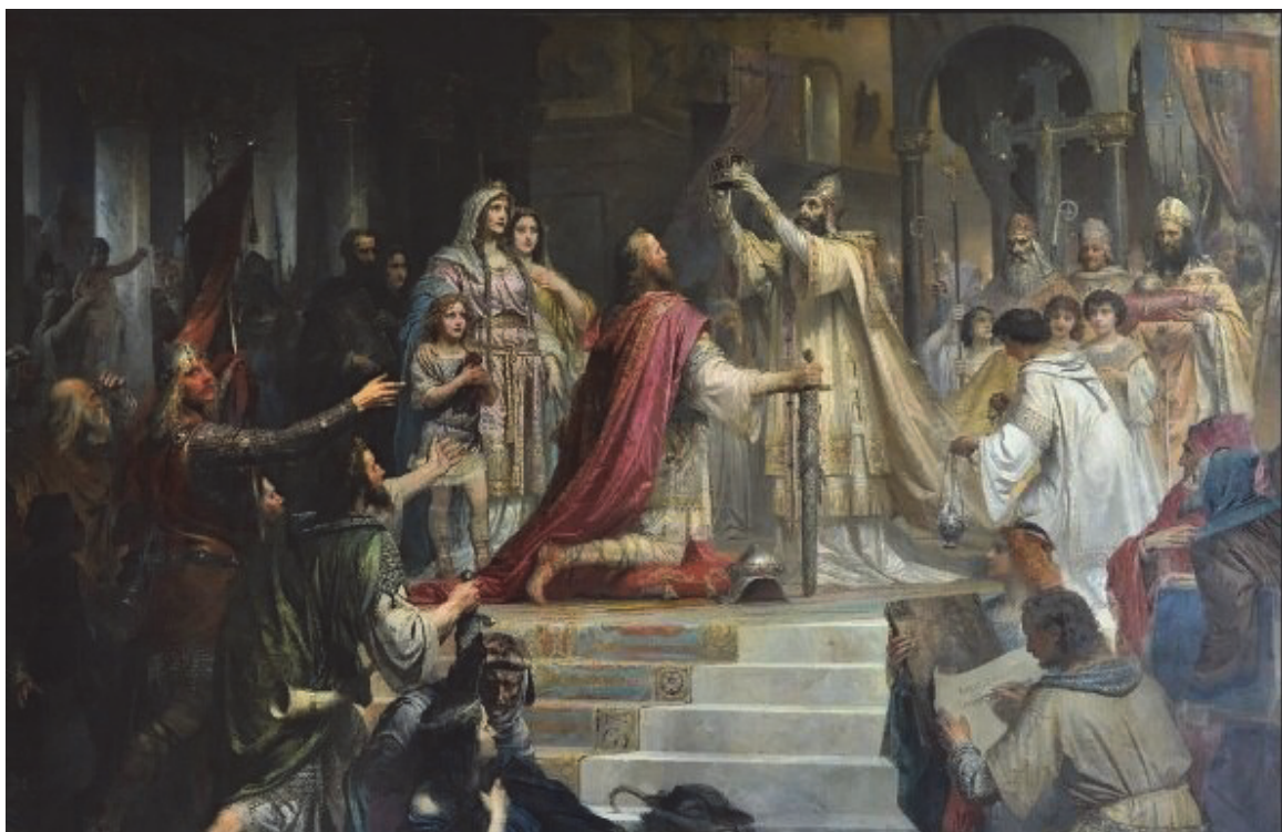
Коронация Карла Великого.