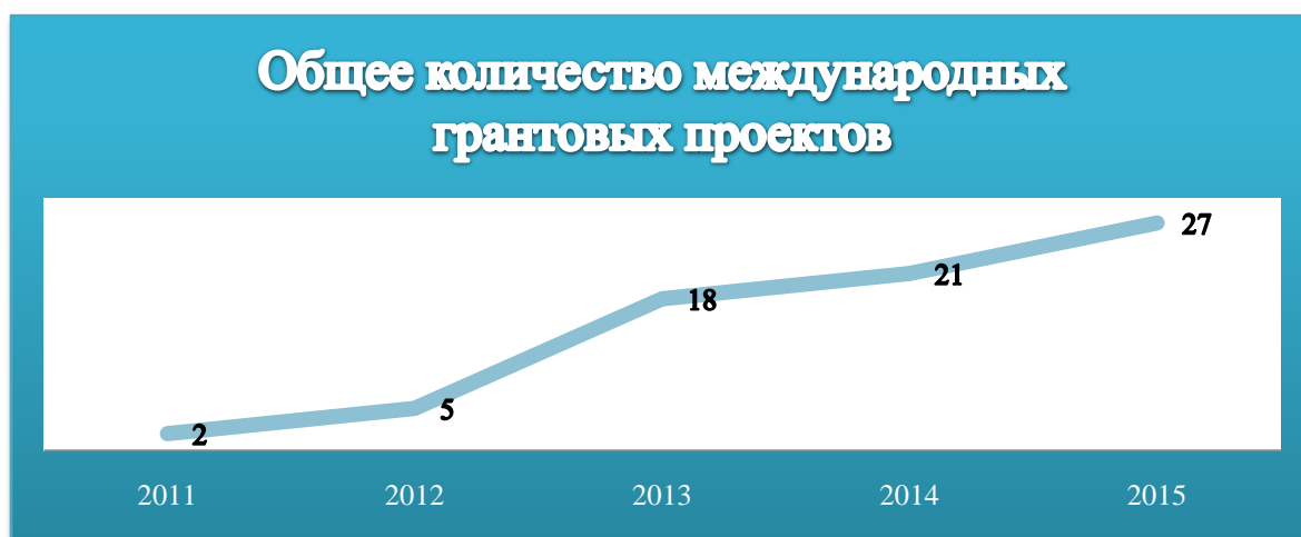
Схема 2. Количество международных проектов 2011-2015гг.

Наиболее крупным из программ академической мобильности является проект ERASMUS MUNDUS «Humanities Education Revitalized via Mundus ExperienceS» 2013-16гг. ( http://international.rau.am/eng/international-projects/hermes ), в рамках которого осуществляются программы мобильности на всех уровнях совместно с семью европейскими университетами и летняя программа «Сеть Восток-Запад» 2013-16гг. ( http://international.rau.am/eng/summer-and-winter-programs/network-east-west-exchange ), которая осуществляется совместно с Юридическим факультетом Гумбольдтского Университета.